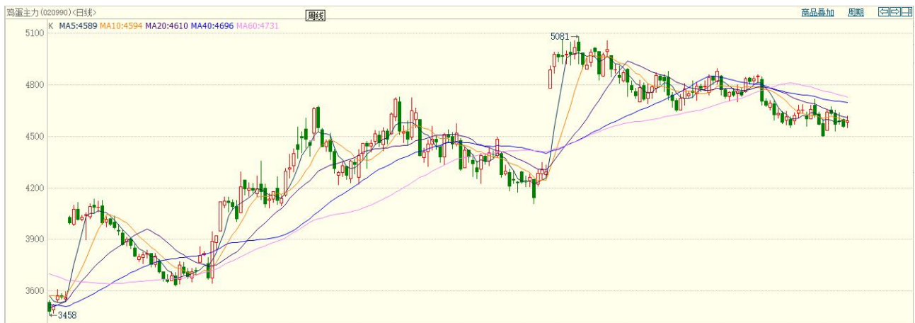
图 1：大商所鸡蛋主力合约走势图