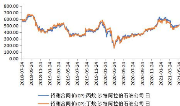
图表 1：CP 预测价格

国际现货方面，沙特阿美公司 2021 年 6 月 CP 出台，丙烷 530 美元/吨，较上月涨 35 美元/吨；丁烷 525 美元/吨，较上月涨 50 美元/吨。国际油价本月呈现上涨态势，市场对于燃油需求前景看好，加之美元加速下滑提振原油，但市场对伊朗增供预期的担忧逐渐增强又抑制了涨幅，最终也有小幅的上涨态势。国际 CP 预期价格受国际原油以及美国航道拥堵等利多因素的支撑，价格亦呈现上涨趋势。