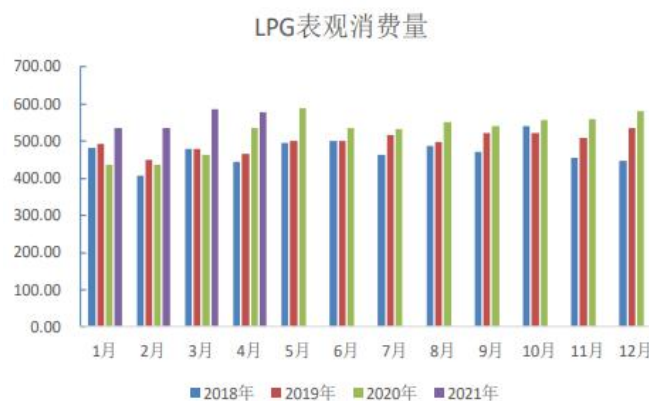
图表 5：中国液化气表观消费量

民用气方面，国内的高温天气范围不断扩大，终端消耗速度下降，下游库存周转放缓，接货意向降低。市场出货减弱，且看跌市场预期心态主导下，采购意向不高，尽管卖方加大优惠，但下游按需补给心态不变，导致炼厂与码头出货都有所放缓。