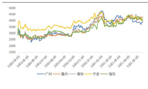
图表 2：LPG 现货价格